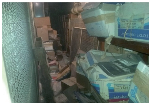
Imagen de los materiales encontrados en depósitos de la AFI.

Los trabajos realizados indican que el primer depósito contaba con 997 cajas/paquetes distribuidos en 698 metros lineales, que el segundo contiene un fondo heterogéneo en cuanto a materiales y formatos de 730 metros lineales y que el depósito de la Dirección de Observaciones Judiciales tenía 465 metros lineales. Es decir que la cantidad aproximada de documentación en poder de la AFI y sujeta a este proceso es de 1893 metros lineales.