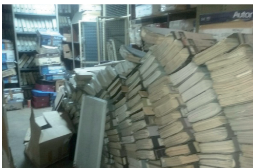
Imagen de los materiales encontrados en depósitos de la AFI.

El primero está compuesto por los documentos pertenecientes a la Secretaría de Inteligencia que fueron desclasificados por el decreto 395/15 y están bajo la custodia de la UFI AMIA (Fondo UFI AMIA). En el marco del proceso de relevamiento se realizó un inventario total de la documentación que determinó la existencia de 2047 carpetas. Todas ellas ya fueron digitalizadas y su contenido está siendo procesado –al cierre de este informe se habían elaborado más de 600 fichas descriptivas con dicha información 5 –.