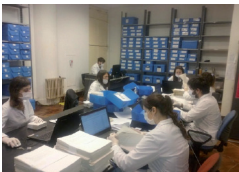
Integrantes del GERAD trabajando sobre los materiales desclasificados.

El GERAD también detectó la existencia de distintas series documentales o colecciones que respondían a la metodología de trabajo utilizada por la Secretaría de Inteligencia y que debían ser tratadas y analizadas siguiendo ese agrupamiento, y no en base a un criterio topológico, para obtener mayor información de conjunto. En función de este hallazgo, se resolvió que para facilitar y agilizar la comprensión y organización del archivo era necesario contar con un nuevo método de trabajo.